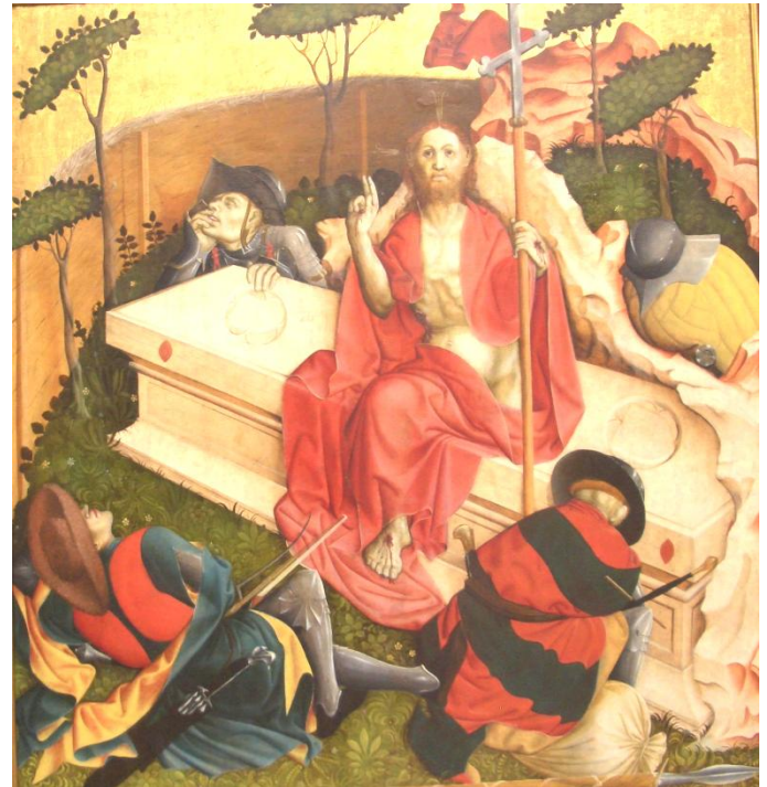
Wurzacher Altar Hans Multscher 1437

die Kinder dürfen ihr Fastenopferkassle am Palmsonntag im Familiengottesdienst in die Kirche bringen.